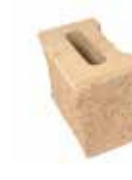
mur element 1/3 22x12x16