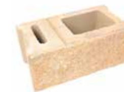
mur element cały 22x38x16