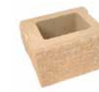
mur element 2/3 22x26x16